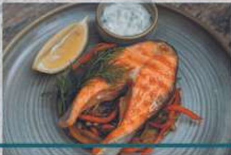
СТЕЙК ЛОСОСЯ НА ГРИЛЕ С СОУСОМ ТАР-ТАР НА ПОДУШКЕ ИЗ ОВОЩЕЙ

Grilled salmon steak with tartar sauce on a pillow of vegetables