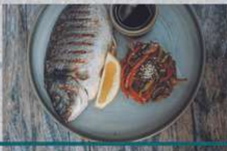
ДОРАДО НА ГРИЛЕ С СОУСОМ НАРШАРАБ НА ПОДУШКЕ ИЗ ОВОЩЕЙ

Grilled dorado with narsharab sauce on a pillow of vegetables