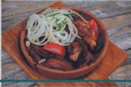
СВИНИНА С КАРТОФЕЛЕМ И ОВОЩАМИ Pork with potatoes and vegetables