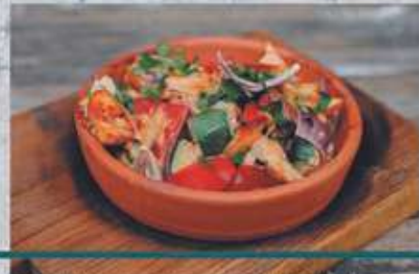
КУРИНАЯ ГРУДКА С ОВОЩАМИ В СЛИВОЧНОМ СОУСЕ

Chicken breast with vegetables in cream sauce