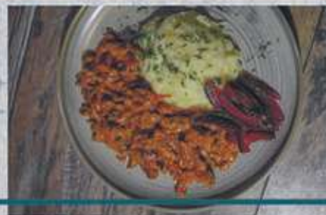
БЕФСТРОГАНОВ ОТ ШЕФА