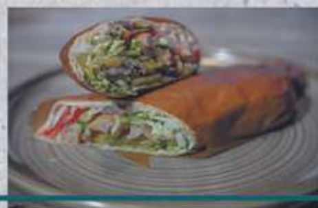
ШАУРМА ФИРМЕННАЯ С КУРИЦЕЙ КЛАССИЧЕСКАЯ/ОСТРАЯ

Shawarma Branded whit chicken classic/spicy